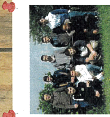
Classe de Maintenance des Bâtiments de Collectivités 2