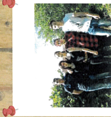
Classe de Terminale Productions Horticoles