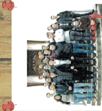
Classe Terminale Aménagements Paysagers