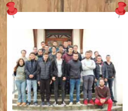
Classe Terminale Aménagements Paysagers